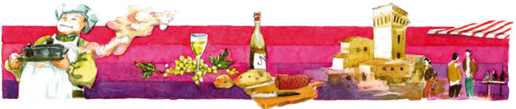
Tavola dl'Arlev - Street Food